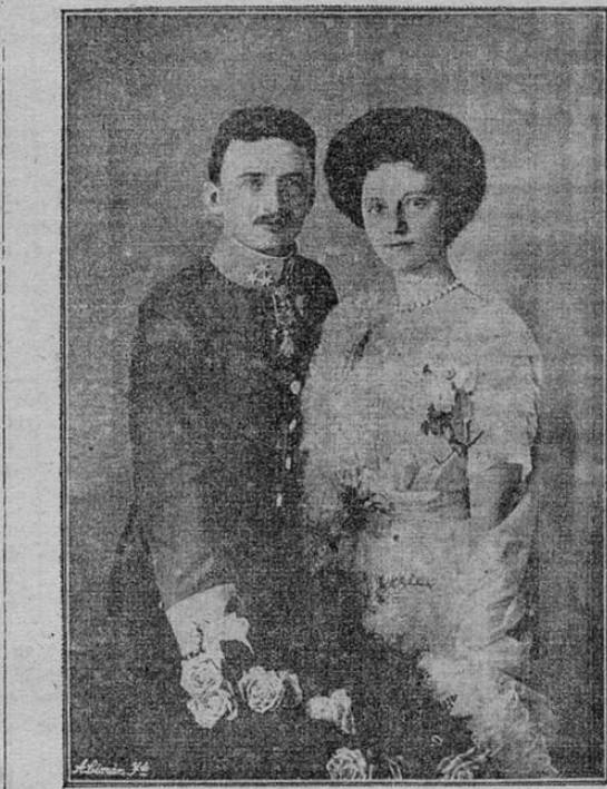
Hereditario de la Corona Archiduque Carlos Francisco José de Austria y la Princesa de Borbón

Nació en 1830 en Venecia a Italia. El imperio austriaco no estuvo por largo tiempo en buena base según la teoría de la ascendencia alemana y fue inevitable que las relaciones entre Austria y Hungría fueran conciliadas. Por un famoso compromiso se formó un Estado austro-húngaro y en junio de 1867 el Emperador Francisco José fue coronado en Pest con la corona de San Estéfano. A pesar de algunas dificultades la doble monarquía existe, gracias a la política adoptada por el Emperador. La princesa Elisabeth fue asesinada en 1898 y el hijo mayor del Emperador, Rodolfo, en 1889. El actual heredero, y desde este momento Emperador de Austria, es el Archiduque Carlos Francisco, que nació en Persenbeug el 17 de agosto de 1887 y casado en 1911 con Zita, princesa de Borbón de Parma, que nació el 9 de mayo de 1892.